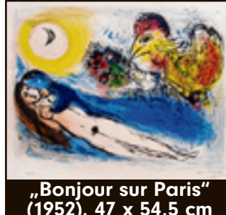
„Bonjour sur Paris“ (1952), 47 x 54,5 cm

„Marc Chagall“, bis 7. Juli 2012, Galerie Neuheisel, Saarbrücken. eis