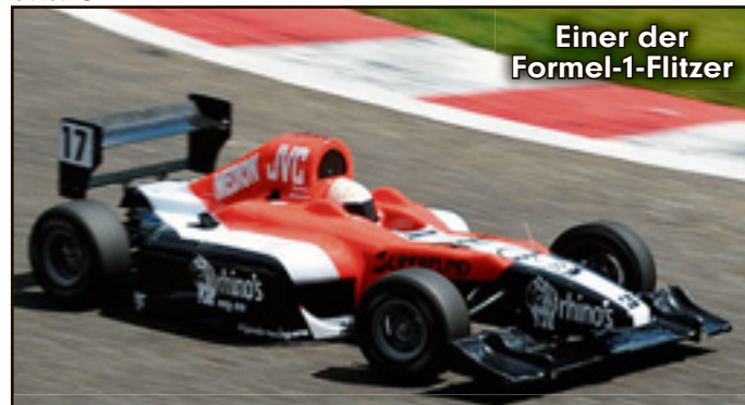
Einer der Formel-1-Flitzer