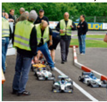
▲ Mit 95 km/h sind die Modelle im Rennen unterwegs

Dafür hat der Club die Strecke modernisiert, in die Technik investiert. jsc