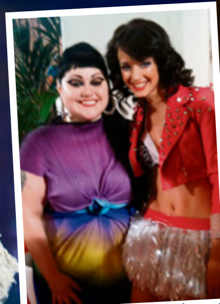
Beth macht Spaß Sympathisch, witzig und gut gelaunt: So erlebte ich Sängerin Beth Dito